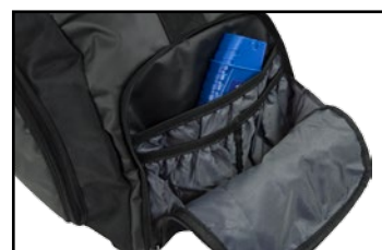
Sidficka med flera småfickor