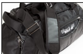
Justerbart axelband med vadderad axelplatta och snygga spännen