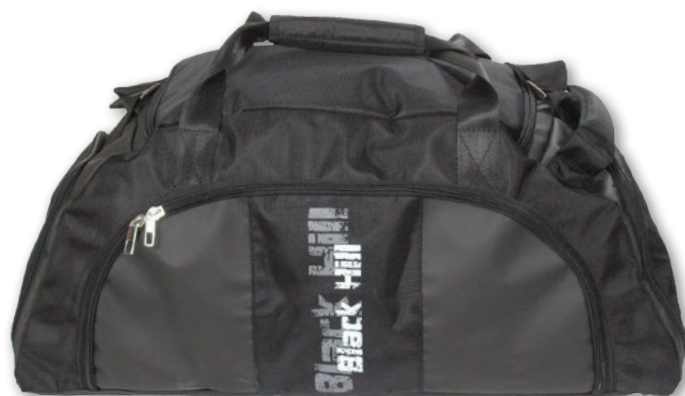
Design på baksidan