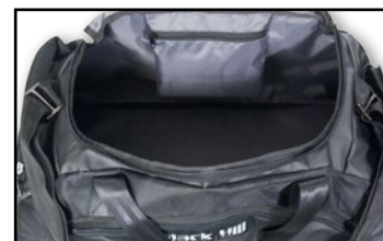
Stort och rymligt huvudfack