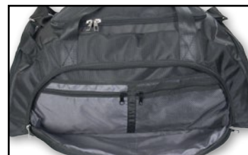
Dragkedjefickor på långsidorna